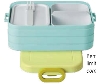
Bento-Lunchbox, limitiert, mepal.com , um € 13,99.

GUTEN APPETIT. Schöner, praktischer und appetitlicher kann man seinen Lunch nicht verpacken. Von Mepal gibt's jetzt noch mehr Dosen-Varianten mit Unterteilungen und Zubehör für jeden Bedarf – vom Salatlunch bis Platz für vier Butterbrote. Die bunten Schälchen machen auch Lust aufs Vorkochen und bewusste Essen. Großes Plus: alles spülmaschinenfest! Infos über mepal.com